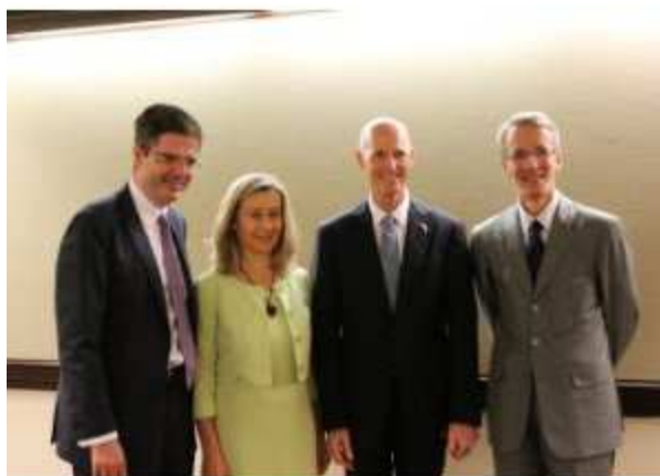
Meeting with Rick Scott, Governor of Florida