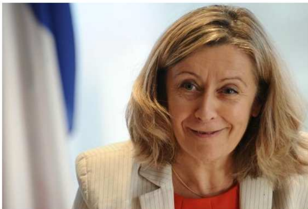
Hélène Conway-Mouret

INTERVIEW - La ministre déléguée chargée des Français de l'étranger répond dans «Les Echos» à Philippe Marini, le président de la commission des Finances du Sénat, au sujet du nombre des Français qui quittent l'Hexagone. La majorité des départs à l'étranger se font pour des raisons professionnelles, assure Hélène Conway-Mouret. Le revenu moyen des foyers expatriés est de 39.000 euros.