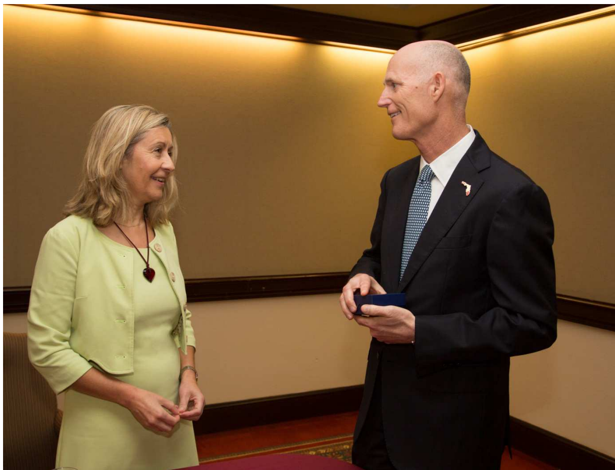
Rencontre avec le gouverneur de Floride, Rick SCOTT, le 31 octobre 2013