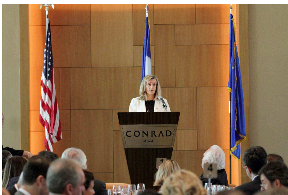
Déjeuner-débat de la Chambre de Commerce de commerce franco-américaine du 1 er novembre 2013, Conrad Hotel, Miami.