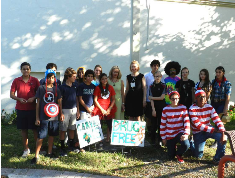
Visit of Carver Middle School

The Minister met also with Barfield's representatives, a Sabena Technics TAT Group Company. They were able to unveil their latest aircraft maintenance equipment, all new proposed solutions to the airlines market.